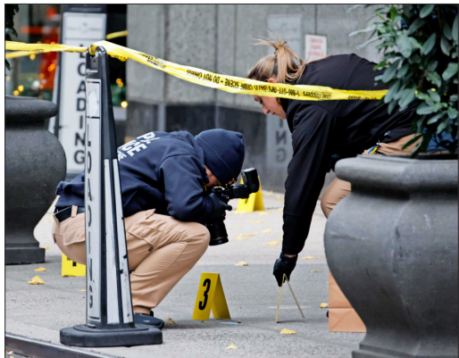
LOS AGENTES de policía han pasado los últimos días investigando la escena del crimen.

El asesino, que según las autoridades actuó de manera "premeditada, planificada y selectiva", fue visto huyendo en bicicleta hacia