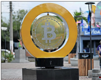
EL SALVADOR adoptó en 2021 el bitcoin como moneda de curso legal.

Según una publicación del mandatario, el valor de las tenencias de bitcoin de El Salvador aumentó en un 117,74%, alcanzando aproximadamente los 603,34 millones de dólares. Las cifras de Bukele muestran que el país invirtió inicialmente alrededor de 269,7 millones de dólares en bitcoin, lo que resultó en una ganancia no realizada de más de 344 millones de dólares. La verdadera ganancia solo se puede conocer cuando se vendan esos bitcoins, como lo explicó a The Associated Press el ex-presidente del Banco Central de