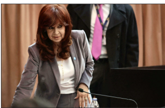
FERNÁNDEZ tiene otros procesos en la justicia, algunos de ellos, por corrupción durante su gestión presidencial.