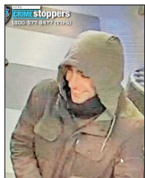
LA POLICÍA DIFUNDIÓ imágenes del principal sospechoso.